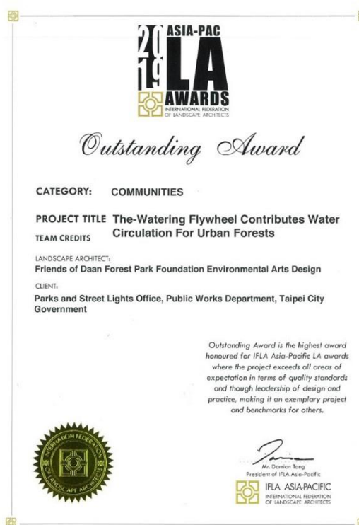
2019國際景觀協會社區類 首獎Outstanding Award

也就是說，「活水飛輪」的設計理念是運用生態池下的雨撲滿，把蓄積的雨水，藉由人力踩踏汲出，這既可增加水中的溶氧，有助於池中的水生物活動；而汲水時，不同的腳踏車，能汲噴出不一樣的水花，能使空氣中增加濕度，讓騎車者便能直接呼吸到公園林木釋放出的芬多精和各式花香；而且每台車上都有 QR CODE 裝置，可放置手機，在輸入個人基本資訊後，可計時三分鐘，計算雙腳已踩汲出多少公升的水？既可和自己在不同時間比賽，也能和其他人一起比賽；是一種結合運動、美學、環保和生態的創新裝置。由於設計創新、環保、生態，所以這個裝置，在短短三、四年內，已榮獲國內外三十多個大獎！2020 年這個設計還榮獲行政院文化部民間版的公共藝術大獎！所以，不少董事笑稱，「活水飛輪」大概是全台灣最會得獎的公園設施！